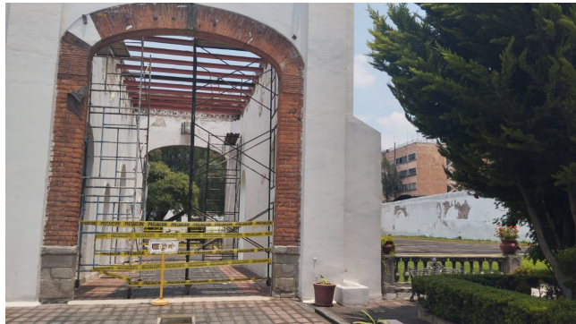
Fig. 6: Inundaciones, plantones y remodelaciones