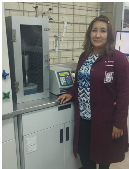
Fig. 4: Preparación de muestras para desvulcanizar caucho.