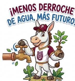
Fig. 5: Frases de concientización de uso del agua.