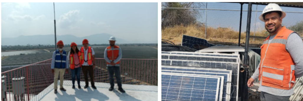
Fig. 3: Evidencia de recolección de paneles solares